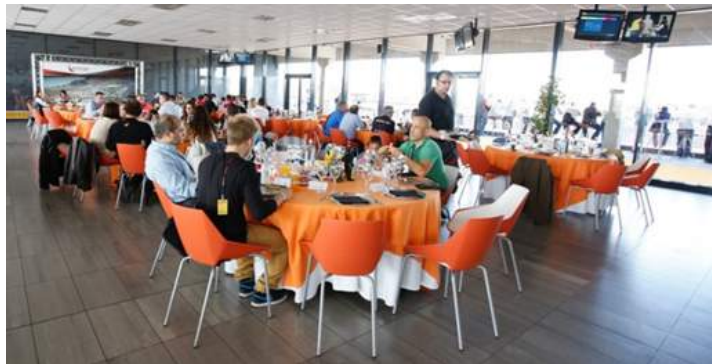
Figura 4.1: Restaurante del karting de MotorLand.

Las instalaciones de MotorLand ofrecerán servicios completos de restauración durante la celebración del Foro «SUBITIS» .