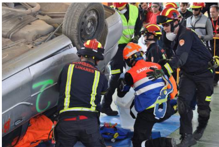
Figura 3.5: Imagen de un ejercicio de rescate en un Campeonato de España ARTE.

Dentro del Foro «SUBITIS» se celebrará el IV Campeonato de España de Rescate en Accidentes de Tráfico ARTE.