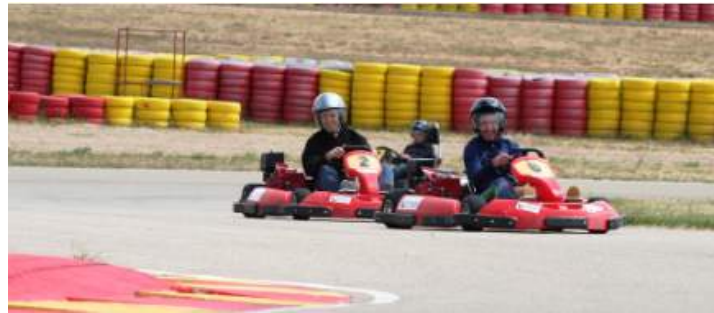
Figura 3.8: Actividades infantiles en MotorLand.

Los acompañantes de los asistentes al Foro «SUBITIS» podrán disfrutar de un gran número de actividades de entretenimiento y ocio.