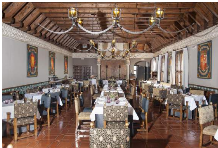
Figura 4.3: Parador de Alcañiz.