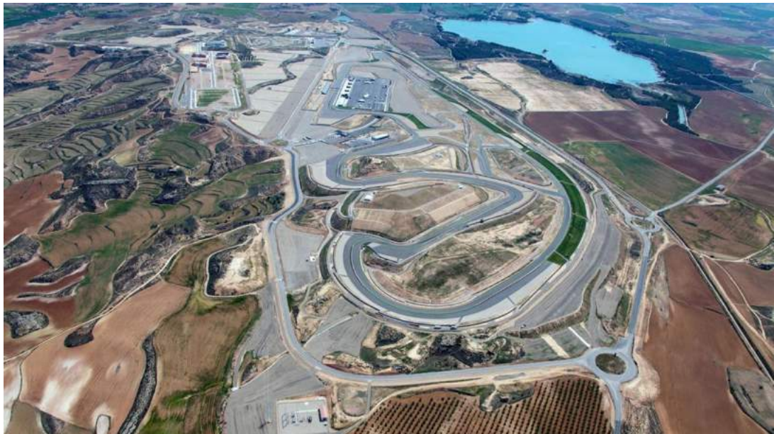
Figura 2.1: El I Foro «SUBITIS» se celebrará en MotorLand.

En este escenario, y como una proyección de « SUBITIS » hacia la Sociedad en general, nace el Foro «SUBITIS» configurado como una semana monográfica con actividades de formación, networking, exhibición y exposición.