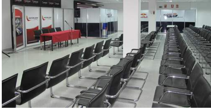
Figura 3.1: Sala donde tendrá lugar la Conferencia «SUBITIS».

trabajo con espíritu abierto, constructivo y autocrítico. En esta primera edición, se contará con la participación de más de veinte profesionales, reconocidos todos ellos como voces autorizadas en distintas vertientes de las emergencias y los grandes desastres.