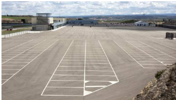
Figura 3.4: Zona de exposición de medios.

Las empresas fabricantes y distribuidoras de material profesional para el sector de las emergencias y grandes desastres cuentan con un espacio en el que exhibir sus productos. Este espacio también está abierto a colectivos profesionales, asociaciones, cuerpos de intervención, etc., que deseen exponer sus actividades y capacidades. Por las características de MotorLand se pueden exhibir materiales pesados.