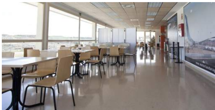
Figura 4.2: Restaurante del circuito de velocidad de MotorLand.

Por otro lado, la Organización del Foro «SUBITIS» facilitará información sobre las posibilidades de alojamiento en el entorno de MotorLand, así como otras ofertas de restauración.