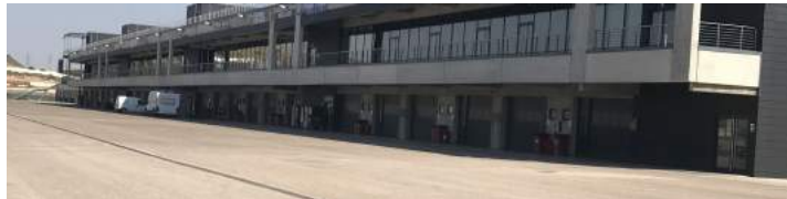
Figura 3.2: Boxes para talleres y seminarios prácticos del Foro «SUBITIS».

En el Foro «SUBITIS» se desarrollarán talleres y seminarios dirigidos a profesionales del sector, disponiéndose para ello de boxes, así como del hospital y helipuertos de MotorLand. El carácter de estos talleres y seminarios es eminentemente práctico.