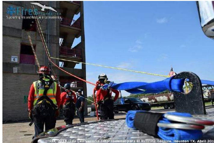
Figura 3.6: Imagen de un ejercicio de rescate en un Campeonato ITREC.

Dentro del Foro «SUBITIS» se celebrará el Campeonato ITREC 2019 de rescate.