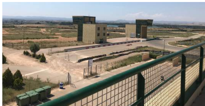
Figura 3.7: MotorLand ofrece múltiples posibilidades para ejercicios de rescate.